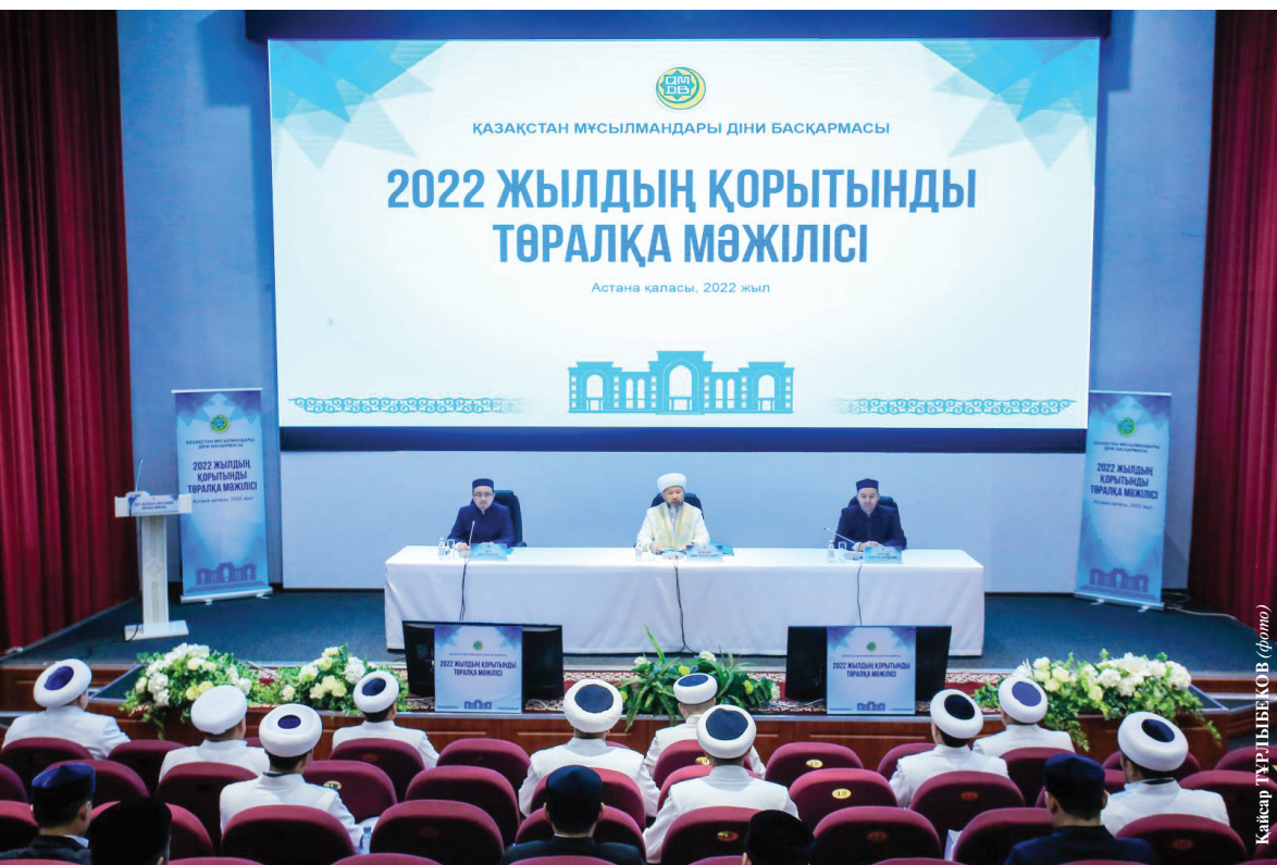
Қайырғұр: ДИЯБЕК (Фотос)